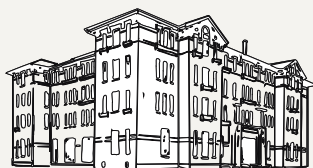
CCO La Rayonne Friche Autre Soie 24 rue Alfred de Musset 69100 Villeurbanne