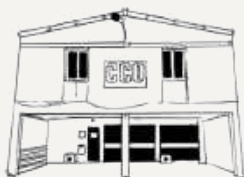
CCO Jean-Pierre Lachaize 39 rue Georges Courteline 69100 Villeurbanne

Création du CCO Plus de 55 ans d'histoire associative, artistique, culturelle, engagée et festive !